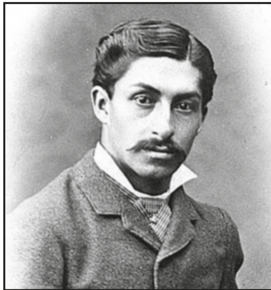
Daniel Alcides Carrión