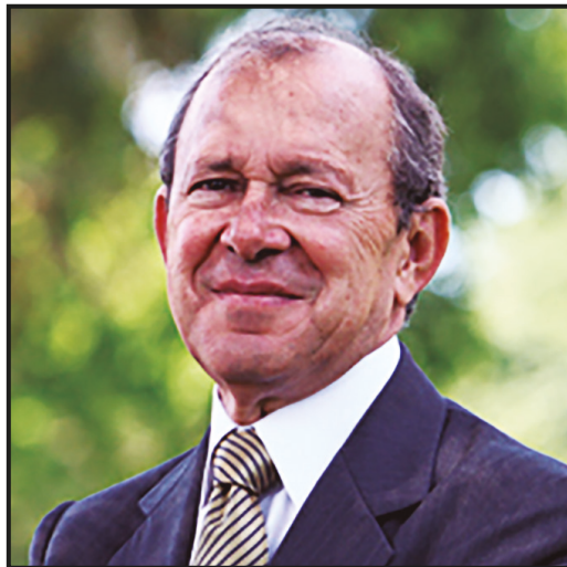
Dr. Salomón Lerner Febres