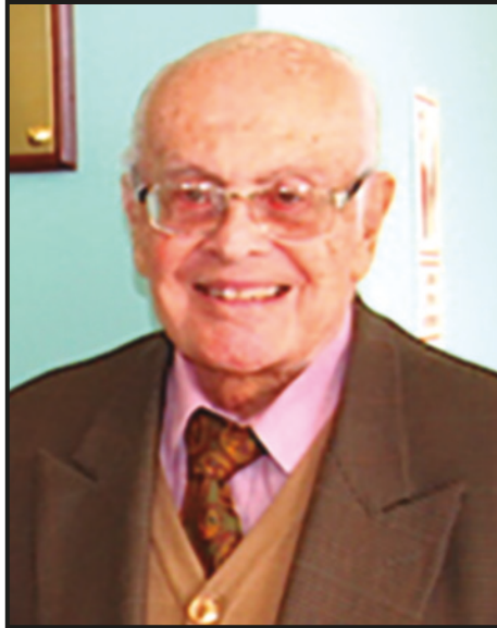
AH Dr. Javier Arias Stella 25 de Febrero

La ANM expresa sus sentidas condolencias a los familiares de los académicos fallecidos doctores: