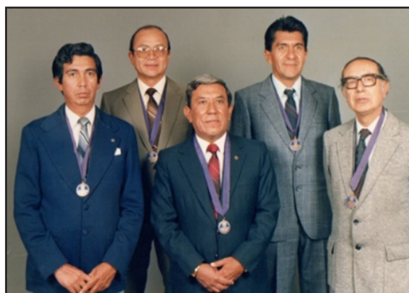
Decano de Consejo Regional V, Colegio Médico del Perú, 1984 - 1986