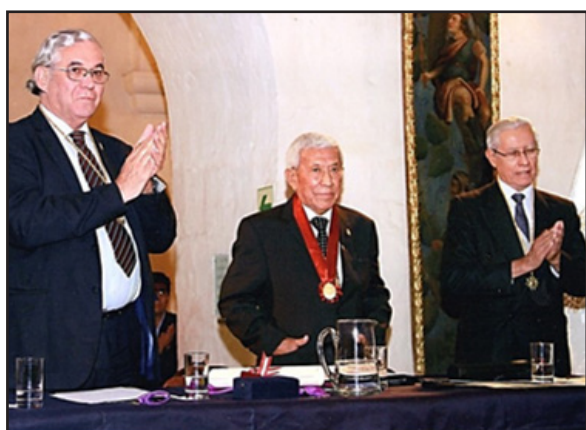
Incorporación como Académico de Número, 214