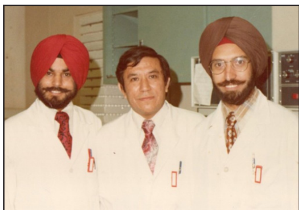
Médico Asociado Inverstigador en Case WesternUniversity, 1973 -1975