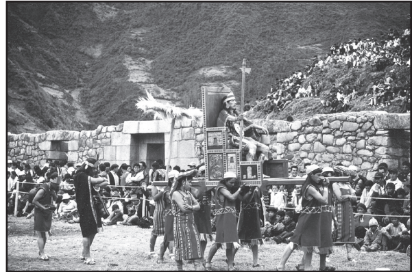
Arriba: Uno de los portones de Vitcos. Abajo: Ceremonia recordando el pasado.