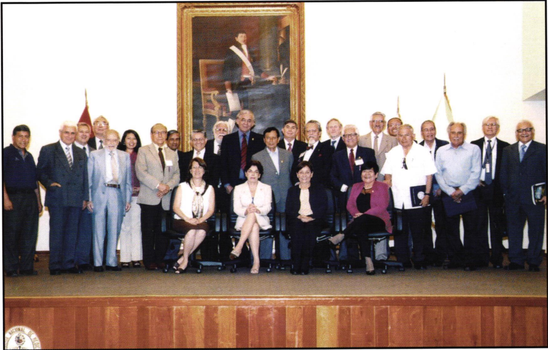
Invitados extranjeros y asistentes al evento