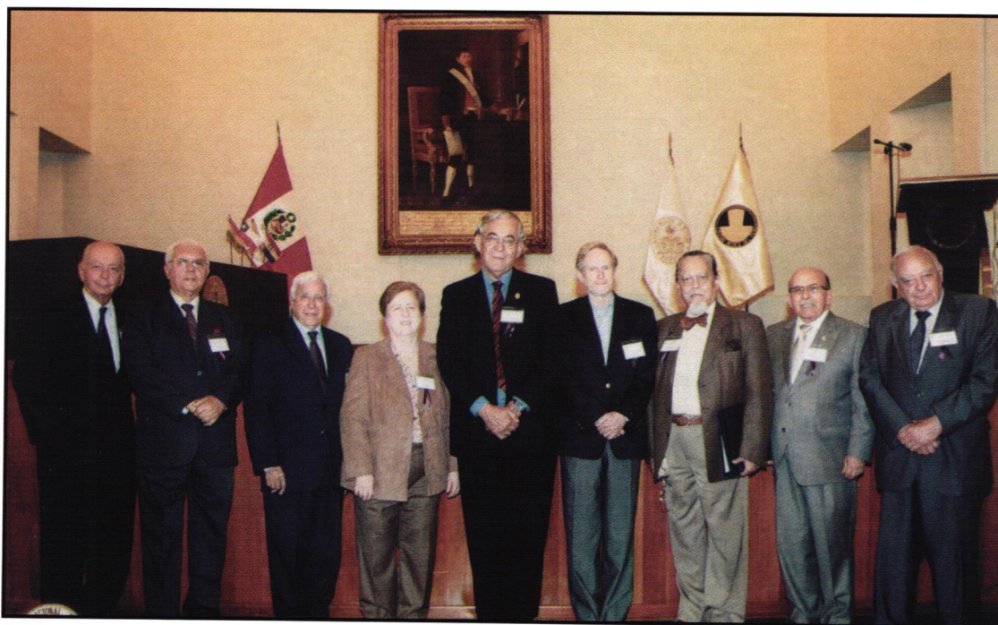
El presidente de la Academia con invitados extranjeros y nacionales en la Reunión Subregional